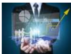
2022 yilning yanvar-noyabr oylarida zarar koʻrgan yirik korxonalar va tashkilotlarning iqtisodiy faoliyat turlari boʻyicha moliyaviy natijalari (jamiga nisbatan foizda)

Iqtisodiy faoliyat turlari boʻyicha tahliliy maʼlumotlar shuni koʻrsatmoqdaki, yirik korxonalar va tashkilotlarda koʻrilgan zararining asosiy qismini: Ulgurji va chakana savdo; motorli transport vositalari va mototsikllarni taʼmirlash faoliyatini koʻrsatuvchilarda 16 108,9 mln. soʻm (jami zararining 63,1 %)ni, togʻ-kon sanoati va ochiq konlarni ishlash 6 406,7 mln. soʻm (jami zararining 25,1 %)ni, ishlab chiqaradigan sanoat faoliyatidagi korxonalarda 1 786,3 mln. soʻm (jami zararining 7,0 %)ni, elektr, gaz, bugʻ bilan taʼminlash va havoni konditsiyalash 752,1 mln. soʻm (jami zararining 2,9 %)ni va qurilish sohasida 485,3 mln. soʻm (jami zararining 1,9 %)ni, tashkil etmoqda.