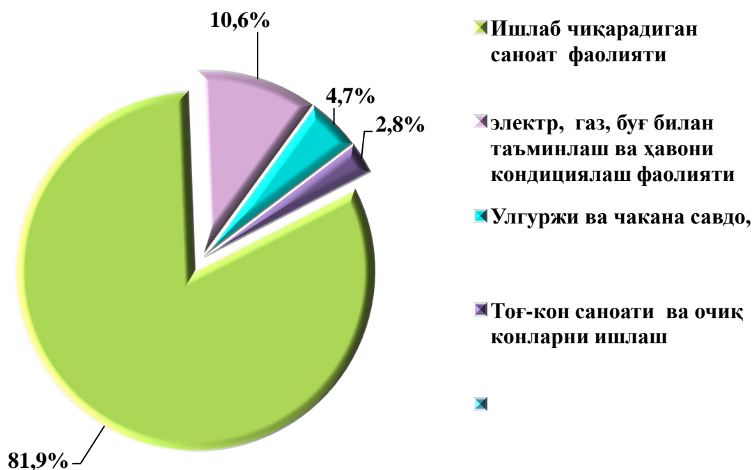
2021 йилнинг январь-февраль ойларида зарар кўрган йирик корхона ва ташкилотларнинг иқтисодий фаолият турлари бўйича молиявий натижалари (жамига нисбатан фоизда)

Иқтисодий фаолият турлари бўйича таҳлилий маълумотлар шуни кўрсатмоқдаки, йирик корхона ва ташкилотларда кўрилган зарарнинг асосий қисмини: ишлаб чиқарадиган саноат фаолиятидаги корхоналарда 5 941,1 млн. сўм (жами зарарнинг 81,9 %) ни, электр, газ, буғ билан таъминлаш ва ҳавони кондициялаш фаолиятини кўрсатувчиларда 767,1 млн. сўм (жами зарарнинг 10,6 %) ни, улгуржи ва чакана савдо, моторли транспорт воситалари ва мотоциклларни таъмирлаш фаолиятини кўрсатувчиларда 343,3 млн. сўм (жами зарарнинг 4,7 %) ни, Тоғ-кон саноати ва очик конларни ишлаш корхоналарда 200,2 млн. сўм (жами зарарнинг 2,8 фоиз) ни ташкил этмоқда.